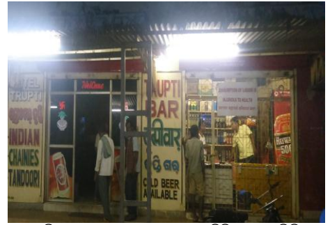
ଚୂପି ବାର୍ ଏଣ୍ଡ ରେଷ୍ଟୁରାଣ୍ଟ, ଭୁବନରେ ଠିପି ବନ୍ଦ ମଦ ବିକ୍ର

ଢେଙ୍କାନାଳ ଜିଲ୍ଲାର 5 ଟି ଠିପିବନ୍ଦ ବିଦେଶୀ ମଦ ଦୋକାନ, 3 ଟି ଠିପିଖୋଲା ବିଦେଶୀମଦ ଦୋକାନ ଏବଂ ଗୋଟିଏ ଦେଶୀ ମଦ ଦୋକାନର ସଂଯୁକ୍ତ ଭୌତିକ ସତ୍ୟାପନ ସମୟରେ ଦେଖାଗଲା ଯେ, ଦୁଇଟି ରେଷ୍ଟୁରାଣ୍ଟ ଦୋକାନ 42 କୁ ଠିପିଖୋଲା ଦୋକାନ ପାଇଁ ଲାଇସେନ୍ସ ପ୍ରଦାନ କରାଯାଇ ଥିଲେହେଁ ସେମାନଙ୍କର ପରିସର ମଧ୍ୟରେ କୌଣସି ରେଷ୍ଟୁରାଣ୍ଟ ନଥିଲା । ଉକ୍ତ ଠିପିଖୋଲା ଦୋକାନ ଲାଇସେନ୍ସପ୍ରାପ୍ତ ବିକ୍ରେତା ମାନେ ଓଡ଼ିଶା ସରକାରଙ୍କ ଦ୍ୱାରା ସ୍ଥିରାକୃତ ଅଧିକତମ ଖୁରୁରା ମୂଲ୍ୟରେ ଦୋକାନ ପରିସର ବାହାରେ ମାଦକ ଦ୍ରବ୍ୟ ବିକ୍ରୟ କରୁଥିଲେ ଯଦିଓ ସେମାନଙ୍କୁ ରେଷ୍ଟୁରାଣ୍ଟ ପରିସର ମଧ୍ୟରେ ମାଦକ ଦ୍ରବ୍ୟର ବିକ୍ରୟ ଲାଇସେନ୍ସ ପ୍ରଦାନ କରାଯାଇଥିଲା । ଏହା ମଧ୍ୟ ଦେଖାଗଲାଯେ, ଉକ୍ତ ଠିପିଖୋଲା ଦୋକାନମାନଙ୍କ ମଧ୍ୟରୁ ଗୋଟିଏ ଦୋକାନ 43 2011-16 ଅବଧି ମଧ୍ୟରେ ସର୍ବନିମ୍ନ