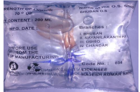
ଭୁବନ ମହୁଲି ମଦ ଦୋକାନ

ପ୍ରତ୍ୟାଭୂତ ପରିମାଣ ୦ାରୁ 815 ରୁ 2,209 ପ୍ରତିଶତ ଅଧିକ ବିଅର୍ ଏବଂ 432 ରୁ 1,418 ପ୍ରତିଶତ ଅଧିକ ଭାରତ ପ୍ରସ୍ତୁତ ବିଦେଶୀ ମଦ ଉଠାଣ କରିଥିଲେ । ପୁନଶ୍ଚ, ଏହା ମଧ୍ୟ ଦେଖାଗଲାଯେ, ଉପରୋକ୍ତ ଖୁରୁରା ଦୋକାନ ଗୁଡ଼ିକରେ ବିକ୍ରୀ ମଦର ଖୋଳ ଉପରେ ଅଧିକତମ ଖୁରୁରା ମୂଲ୍ୟ, ବ୍ୟାଚ୍ ସଂଖ୍ୟା ଏବଂ ପ୍ରସ୍ତୁତି ତାରିଖ ଛାପା ଯାଇନଥିଲା, ଯାହା ଅଧିନିୟମ ଏବଂ ନିୟମାବଳୀର ବ୍ୟବସ୍ଥା ଅନୁସାରେ ପ୍ରବର୍ତ୍ତନ କାର୍ଯ୍ୟକଳାପର ବିଫଳତାକୁ ସୂଚିତ କରୁଥିଲା ।