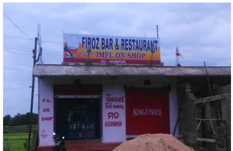
ହରିପୁର ଅନ୍ ରେଷ୍ଟୁରାଣ୍ଟ ଦୋକାନ, ଢେଙ୍କାନାଳରେ ଠିପି ବନ୍ଦ ମଦ ବିକ୍ରି

ଓଡ଼ିଶା ଅବକାରୀ ନିୟମାବଳୀ, 1965 ର ନିୟମ-46(3) ଅନୁସାରେ ପରିସର ଭିତରେ ଉପଭୋଗ ନିମନ୍ତେ ବିଦେଶୀ ମଦର ବିକ୍ରୟ ପାଇଁ ଲାଇସେନ୍ସ ପ୍ରାପ୍ତ କୌଣସି ବିକ୍ରେତାଙ୍କୁ ପରିସର ବାହାରେ ଉପଭୋଗ ନିମନ୍ତେ ବିଦେଶୀ ମଦର ବିକ୍ରୟ ପାଇଁ କିମ୍ବା ଏହାର ବିପରୀତ କ୍ରମରେ ଲାଇସେନ୍ସ ପ୍ରଦାନ କରାଯିବ ନାହିଁ । ପୁନଶ୍ଚ, ଠିପିଖୋଲା ଦୋକାନର ଲାଇସେନ୍ସ ପ୍ରଦାନ ନିମନ୍ତେ ଫର୍ମ ଏଫ୍.ଏଲ୍-8 ର ସର୍ତ୍ତାବଳୀଗୁଡ଼ିକ ମଧ୍ୟରୁ ଏକ ସଭ୍ ଅଛି ଯେ ଠିପି ଖୋଲା ଦୋକାନରେ ବିକ୍ରୀ ସମସ୍ତ ମଦ ବିକ୍ରେତାଙ୍କ ପରିସର ମଧ୍ୟରେ ଉପଭୋଗ କରାଯିବ ଏବଂ ଲାଇସେନ୍ସ ପ୍ରାପ୍ତ ବ୍ୟକ୍ତି ଖୁରୁରା ଠିପିବନ୍ଦ ଦୋକାନ ପାଇଁ ଏକ ପୃଥକ ଲାଇସେନ୍ସ